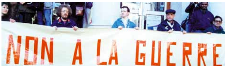
Manifestation contre la guerre du Golfe à Nantes en 1991

aux Archives départementales le 10 décembre 2010, de 9h à 18 h