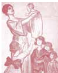
Affiche (1920)

Professeur de démographie laboratoire CURAPP, université de Picardie Jules Verne