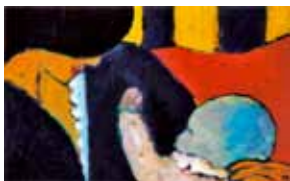
Bruno à l'édredon rouge (détail) huile, 1988