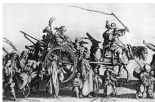
Bohémiens en marche de Jacques Callot, 1592-1635

Doctorant en histoire, universités de Nantes et de Bourgogne