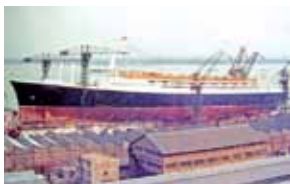
Lancement du France en 1960