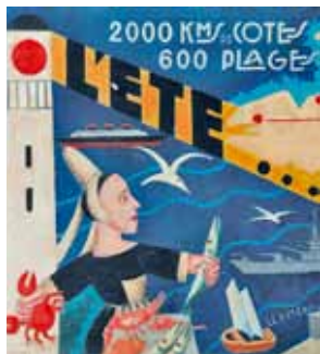
« L'Été - l'État » de Maria Ivanovna Vassilieff, 1937

Conservateur du Musée départemental breton de Quimper