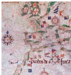
Portulan de Pedro Reinel, 1504

Historien, maître de conférences à l'université de Nantes